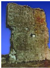
Gruppo Maranthà Onlus

Ministero dell'Istruzione, dell'Università e della Ricerca Ufficio Scolastico Regionale per la Calabria Direzione Generale Ufficio V